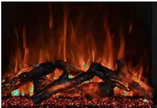
Flama Naranja - Inicia sesión