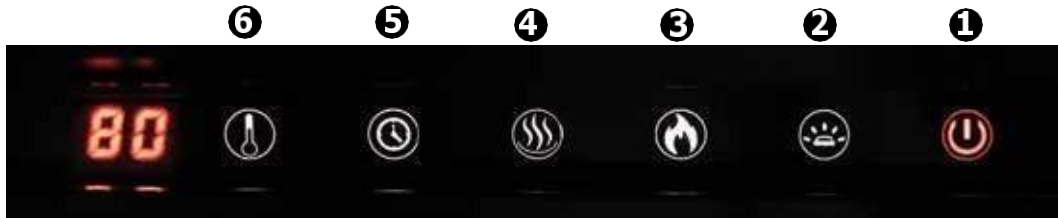
Panel de control de botones táctiles

Iluminación de espectro a todo color para llamas, lecho de ascuas y iluminación descendente