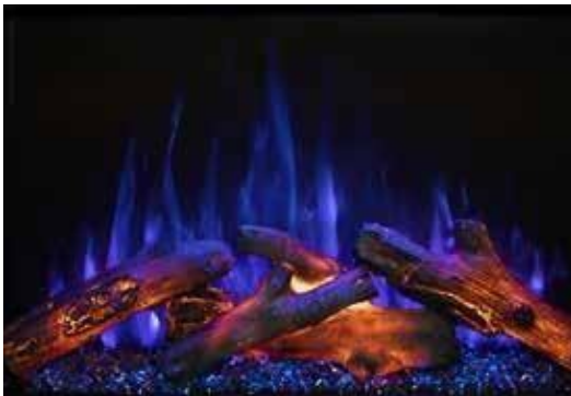
Flama Azul - Inicia sesión

Colores de la cama de llama y ascuas controlados de forma independiente