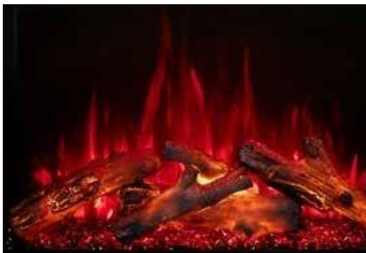
Flama Roja - Inicia sesión