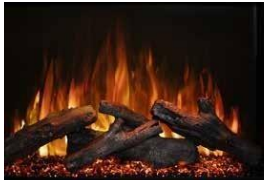
Flama Naranja - Cierra la sesión