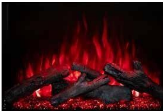
Flama Roja - Cierra la sesión