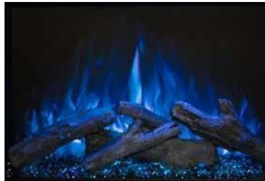
Flama Axul - Cierra la sesión