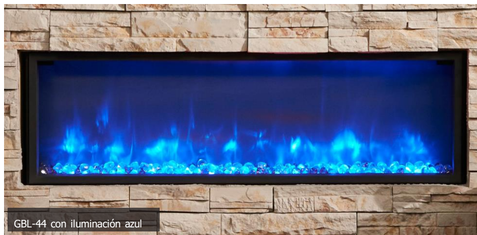
GBL-44 con iluminación azul