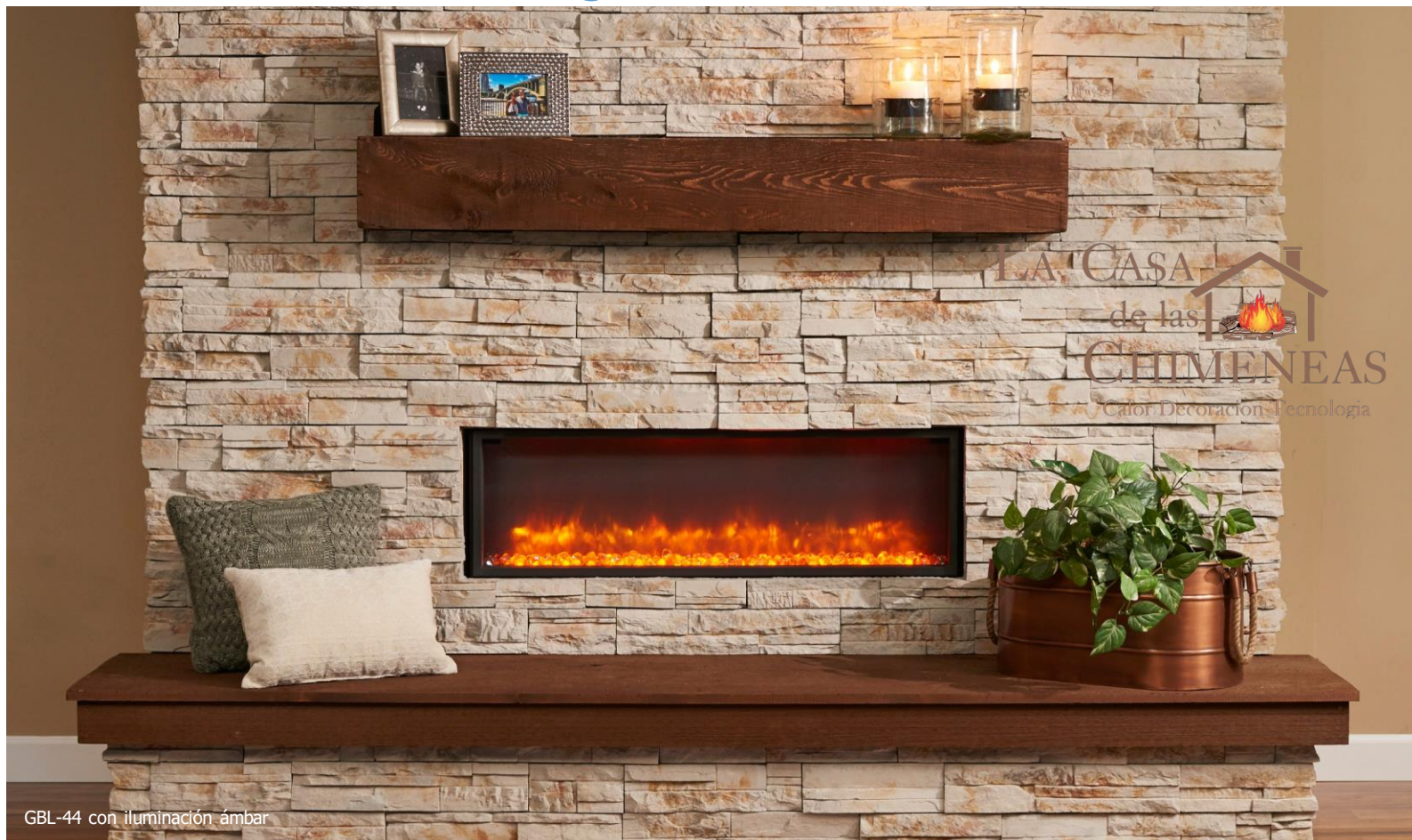
GBL-44 con iluminación ámbar