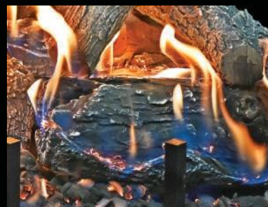
Se muestra: Quemador de 24" con juego de leños carbonizados de roble desgastado