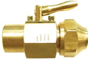
LLAVE FLAIR SOLDABLE DE DE 1/2 A 3/8

Si la presión de gas no es la adecuada el sistema no funcionara y tampoco se podrá instalar el sistema La presión debe ser de 28 grs. x cm2 para sistemas de gas LP